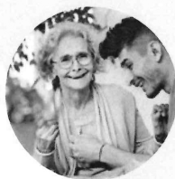
Kreativität und Kultur