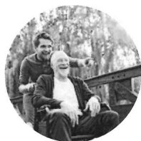
Zuwendung und Nähe

Der Schritt in eine Senioren-Residenz ist kein leichter. Das wissen wir – und genau deshalb wollen wir Ihnen hier ein echtes Zuhause schaffen. Dabei bieten die vier Bausteine unseres wertschätzenden, dem ganzen Menschen zugewandten Pflegekonzeptes alles, was man für ein gutes Leben benötigt.