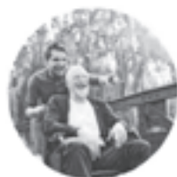
Zuwendung und Nähe

Der Schritt in eine Senioren-Residenz ist kein leichter. Das wissen wir – und genau deshalb wollen wir Ihnen hier ein echtes Zuhause schaffen. Dabei bieten die vier Bausteine unseres wertschätzenden, dem ganzen Menschen zugewandten Pflegekonzeptes alles, was man für ein gutes Leben benötigt.