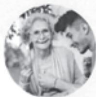
Kreativität und Kultur